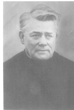
P. František Maria od Kříže Jordan