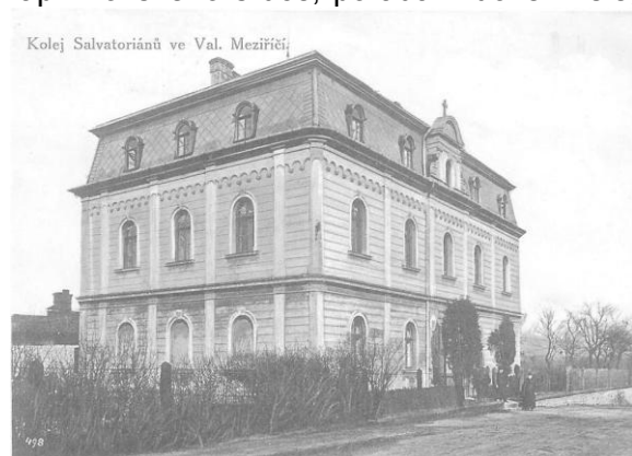
Kolej Salvatoriánů ve Val. Meziříčí

1909 byl konvikt zrušen, věnovali se členové výhradně výpomoci v duchovní správě v blízkém i vzdálenějším okolí. Nadále samozřejmě pečovali o výchovu a studijní výsledky svěřených a ubytovaných katolických studentů gymnasia. Objekt, který zde salvatoriáni na Žerotínově ulici postupně vybudovali a který jim komunisté v roce 1950 definitivně zcizili, je v naší veřejnosti znám spíše jako bývalá léčebna dlouhodobě nemocných (LDN).