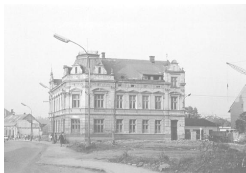
Budova kláštera v 80. letech před asanací