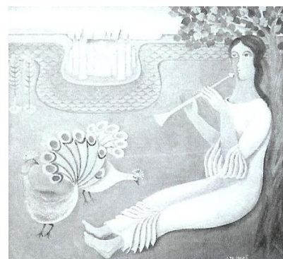
Pastýřka, olejomalba. 2002