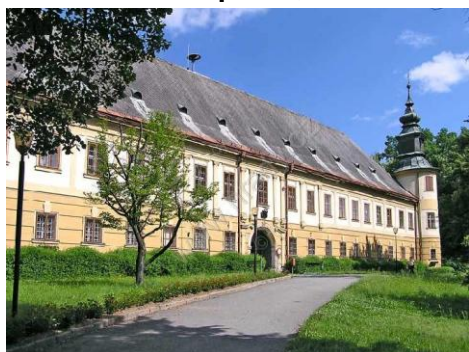
Zámek v Bludově