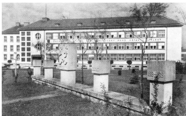
Foto: Původní umístění památníku Čsl. Legiím před budovou tehdejšího Učitelského ústavu – dnes ZŠ Šafaříkova. Po 2. světové válce přemístěn před dnešní budovu Obchodní akademie.

3.5.1920 - Zemská správa politická v Brně schválila stanovy "Jednoty Družiny čs. legionářů ve Valašském Meziříčí". Tento spolek, nesoucí později označení Místní jednota Československé obce legionářské ve Valašském Meziříčí, byl výnosem říšského protektora pro Čechy a Moravu ze dne 25.8.1939 rozpuštěn.