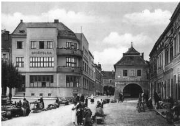
Foto: Budova spořitelny

V roce 1914 absolvoval pražskou techniku a v letech 1922-1927 byl profesorem na stavební průmyslovce v Bratislavě. Projektoval zde budovu YMCA, Radiožurnálu, Zemské pojišťovny, Umělecké besedy slovenské a další. Byl i autorem regulačních plánů Bratislavy, Púchova, Malacek a Lučence. Po roce 1939 musel opustit Slovensko a působil jako městský architekt ve Valašském Meziříčí. Pro své rodné město vytvořil projekt Městské spořitelny. Po roce 1948 pracoval na oddělení územního plánování KNV Gottwaldov (Zlín).